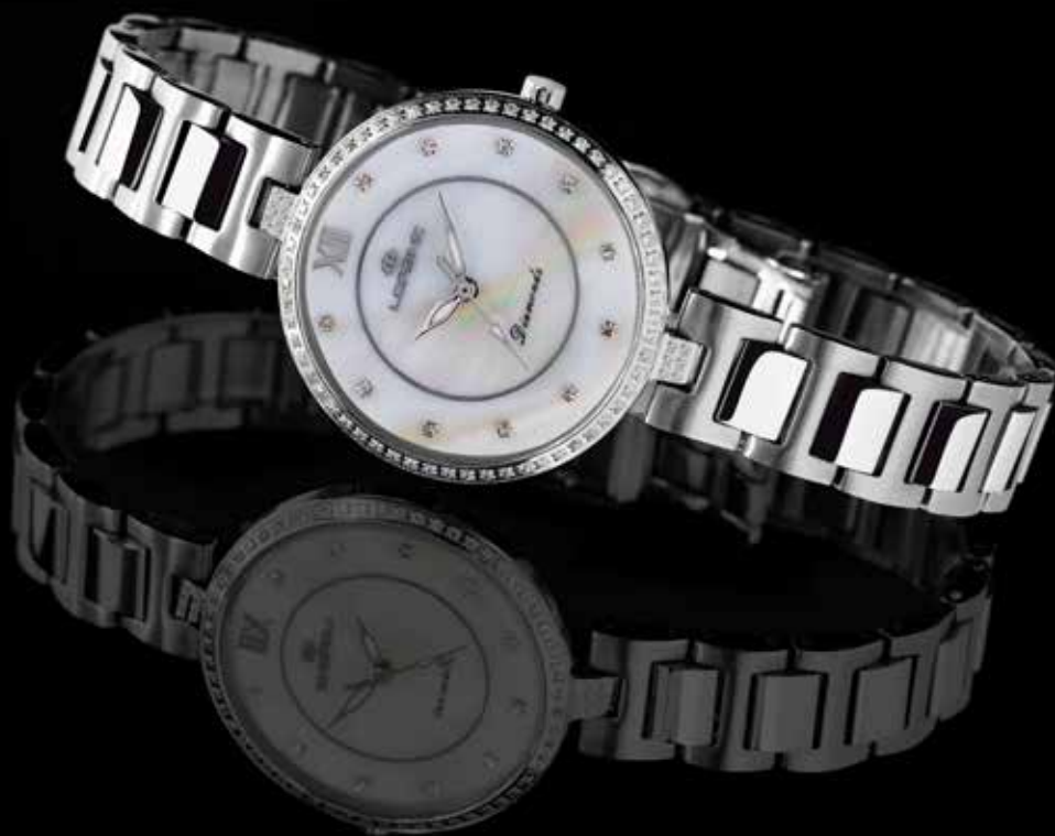
Modello Diva Diamonds, ref. 30118AA

Lorenz presenta la collezioni donna diamanti, preziosi segnatempo arricchiti da diamanti per la donna elegante che ama distinguersi portando al polso un oggetto unico e ricercato.